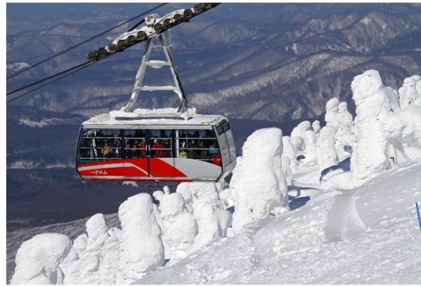
Mt,Hakkoda Aomori city