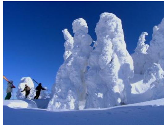
Mt,moriyoshi Kita-akita city