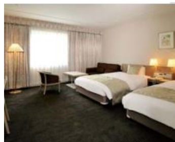
ツインルーム（一例）

青森を代表する格式あるシティホテル。 市内ホテルで唯一、17階にバーラウンジがあり夜景を眺めながら青森の銘柄、オリジナルカクテルが楽しめます。